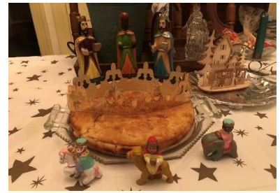
Torta dei Tre Re