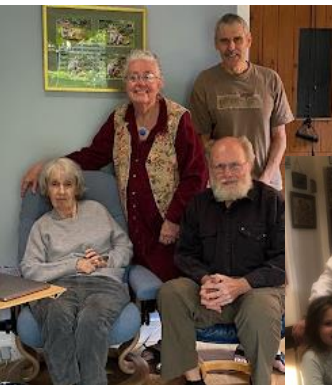
Con amici in Inghilterra