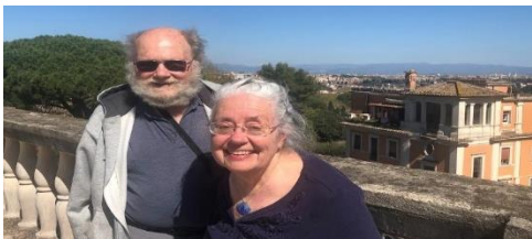
All'Accademia Americana di Roma