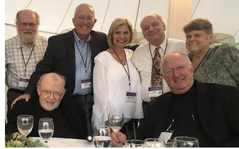
Amici del college di 50 anni fa