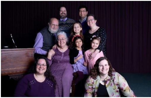
Salve, Salve, la banda è tutta qui!