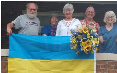
Accogliere gli ukraiini a Monmouth