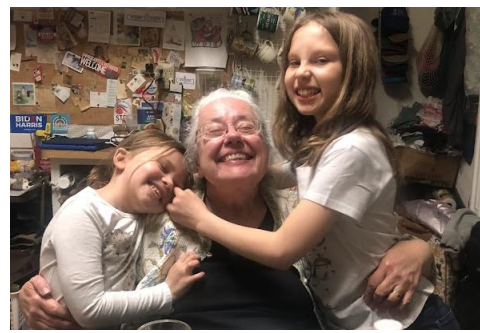
Braccia piene d'amore