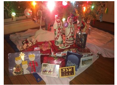
La visita dei Re Magi il 6 gennaio!