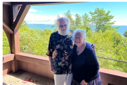
Al Vesper Hill Chapel agosto 2022