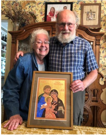
Icona della Sacra Famiglia di Mika per il nostro 50° anniversario