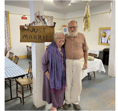
"Appena sposato" 50 anni fa!