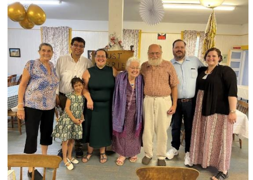
Alla nostra festa di anniversario