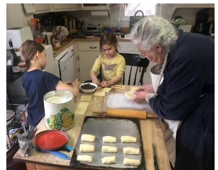
Preparare i Petits Pains al cioccolato