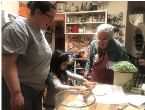
Dorothy aiuta la nonna a fare la pizza