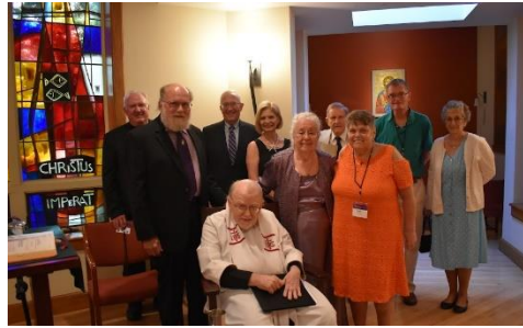
Rinnoviamo le nostre promesse matrimoniali