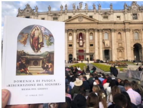
Domenica di Pasqua a Roma