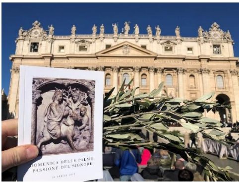
Domenica delle Palme a Roma