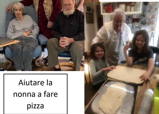
Aiutare la nonna a fare pizza