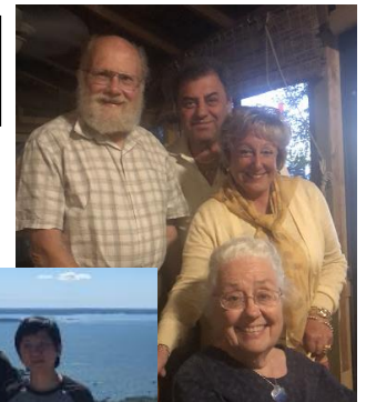
Con amici nel Maine